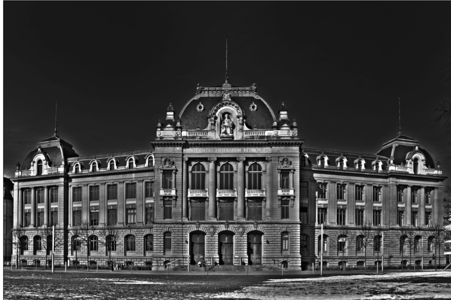
Abb. 1 Das Hauptgebäude der Universität Bern mit der Inschrift UNIVERSITAS LITTERARUM BERNENSIS 2

Eine Universität vereint viele, einzelne, verschiedene Gelehrte und Studierende und sie verbindet viele, einzelne, verschiedene Wissenschaften. Das Widerspiel der Kräfte ist ihr inhärent. Indessen habe ich den Eindruck, dass in den letzten Jahrzehnten die Spannungen sich mehren und verschärfen, auf jeden Fall sich deutlicher artikulieren. 3