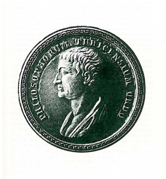
Abb. 4 Das Siegel der philosophischen Fakultät der Universität Zürich mit der Umschrift PHILOSOPHORUM TURICENSIVM ORDO

Wahl eines Bildes von Aristoteles für das gemeinsame Siegel: Die Naturwissenschaften des beginnenden 19. Jahrhunderts sind im deutschen Sprachraum – im Unterschied zu Frankreich und England – stark von naturphilosophischen Gedanken geprägt. 29